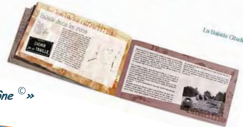
La Balade Citadine