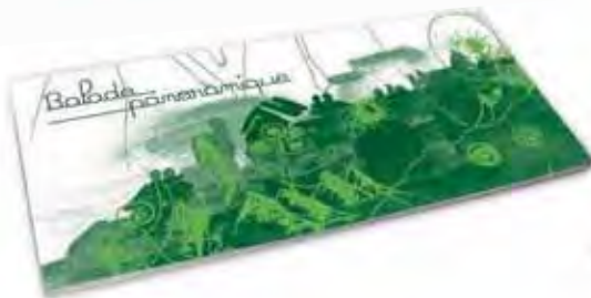
La Balade Panoramique