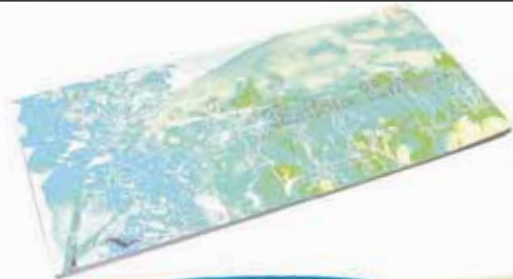
La Balade Poétique